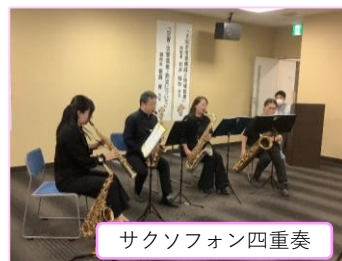
サクソフォン四重奏