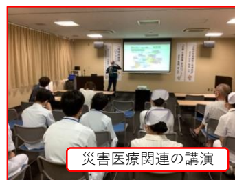
災害医療関連の講演