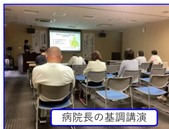
病院長の基調講演

また、地域医療部によるご来院者参加型の〇×クイズの実施や有志によるウインドシンフォニーサクソフォン四重奏の演奏も行われ、癒しの音色が響き渡りましたを開催しました。多くの来院者にご参加いただき、大いに盛り上がりました。