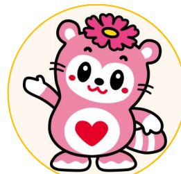
さぬき市社会福祉協議会キャラクター「ふっきーちゃん」

座って出来るストレッチや筋力アップの運動・お口の体操・認知症予防を楽しく行う元気な体づくりの教室です♪