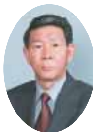
さぬき市議会議長

さて、年が改まりましたも、まだまだ厳しい経済情勢が続いております。地方分権社会の確立に向けた「三位一体の改革」の推進は、国庫補助負担金の削減や地方交付税の減額などが盛り込まれ、地方の課題は地方自らの判断と