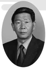
さぬき市議会議長

さぬき市においては、国の地方財政対策等を見極めながら行政改革の強い志と時代に即した経営感覚を持って、「行政改革実施計画」や「集中改革プラン」に沿った施策の「選択と集中」を進めるとともに、さぬき市総合計画の基本理念である「自立する都市」の実現に向けた明確なビジョンと方向性を持ち、「簡素で効率的、持続可能な行財政システムの構築」、「活力あるまちづくり」、「安全で快適なまちづくり」、「安心して暮らせるまちづくり」、「人の心の豊かなまちづくり」の実現に向けて、市民の皆様とともに創意と工夫を凝らし、「みんなで暮らすふるさと さぬき」の創造を目指します。最後にになりましたが、本年は、さぬき市にとりまして昨年にも増して財政事情等が厳しい年になることが予想されますが、市民の皆様一人一人にとりまして、幸多い年となりますよう心から祈念申し上げます。年頭のごあいさつといたします。