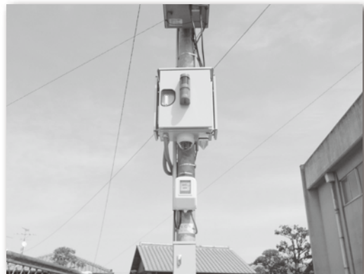
緊急記録警報装置(防犯カメラ)

詳しいことについては、さぬき警察署生活安全課、さぬき市生活環境課までお問い合わせください。