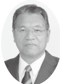
むぐるまと みか 六車十三日