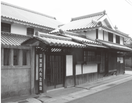
旧平賀家住宅主屋

登録有形文化財は、建てられてから50年以上の歴史的建造物を活用しながら緩やかな規制のもとで保護していくこととする制度で、ヨーロッパをはじめとする世界各国ですでに定着し、文化財保存に大きな役割を果たしています。本市では旧平賀家住宅主屋の外に、弥勒石穴、いしや旅館が登録有形文化財となっています。